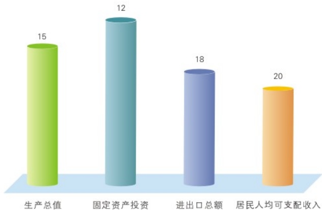
2017年陕西主要指标在全国的位次